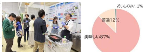
図4. アグリビジネス創出フェアにおける新グラスフェッドの出展、試食及びアンケート調査の様子。出展時期：2025年11月26日-28日。外モモとブリスケ(胸身)の切り身を塩コショウのみで調理したグラスフェッド和牛肉で試食アンケート(n=411)。