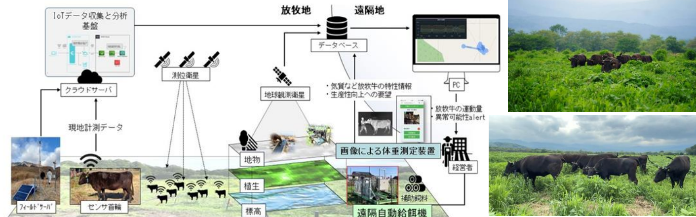
図2. スマート放牧における技術(左図)と代謝プログラミング処理された放牧肥育牛(右図)

個々の放牧牛の行動履歴に関するデータと放牧地の草量データから放牧における補助飼料供給を最適化する飼養管理システムを設計。放牧牛の行動履歴や運動量、体調に関するデータを取得するための装着型センサの設計と検証