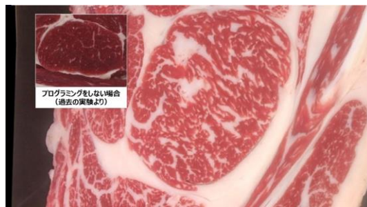
図3. 胎児期及び新生児期プログラミング後に放牧で肥育された黒毛和牛第1号出荷牛のロース芯の断面と代謝プログラミングせずに肥育された黒毛和牛のロース芯。