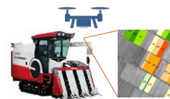
ドローンを活用した 適期収穫