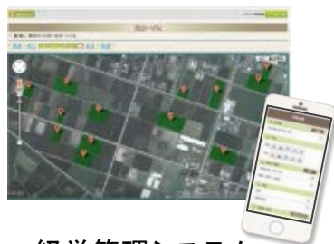
経営管理システム