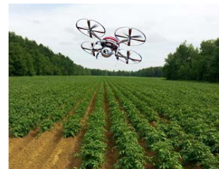
ドローンを活用した 生育・病害虫モニタリング