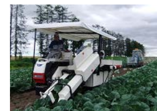
重量野菜の自動収穫機