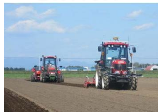
ロボットトラクタ