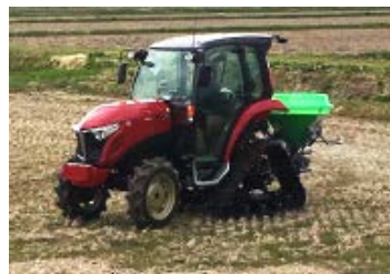
可変施肥トラクター