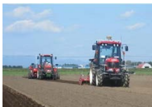
自動走行トラクター