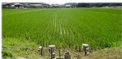
地下水位制御システム