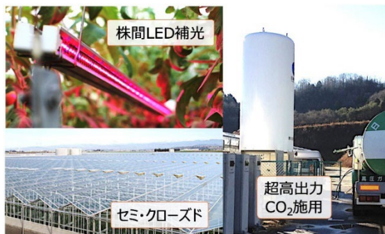
太陽光植物工場における先進的トマト生産の様子

このため、本研究では、AIを活用した生育情報計測技術と計測データに基づく栽培・労務管理の最適化技術の開発に取り組みました。