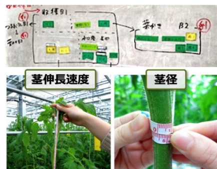
従来の労務管理（上）と生育調査（下）の様子