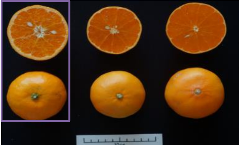
あすき あすみ せとか