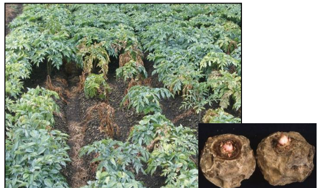
こんにゃくの主要病害の根腐病