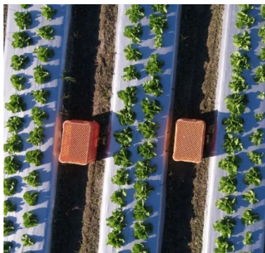
レタスほ場の可視光空撮画像

また、こんにゃくは主要病害の防除対策とその効率化が課題であるため、ドローン空撮画像を用いた病害発生状況推定手法の開発に取り組みました。