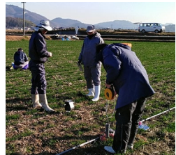
茶・かんしょなど現地実証試験