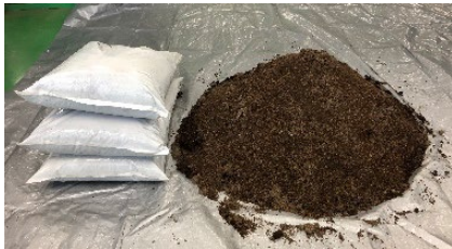
新下水汚泥肥料の安定供給