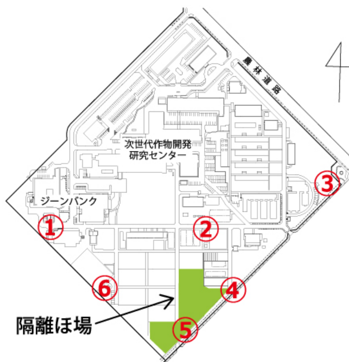
図 3 観音台第 2 事業場隔離ほ場（緑色）周辺のモニタリング用モチイネの設置場所 ①から⑥の位置で、花粉飛散モニタリング用モチ品種「はくちょうもち」を栽培します。