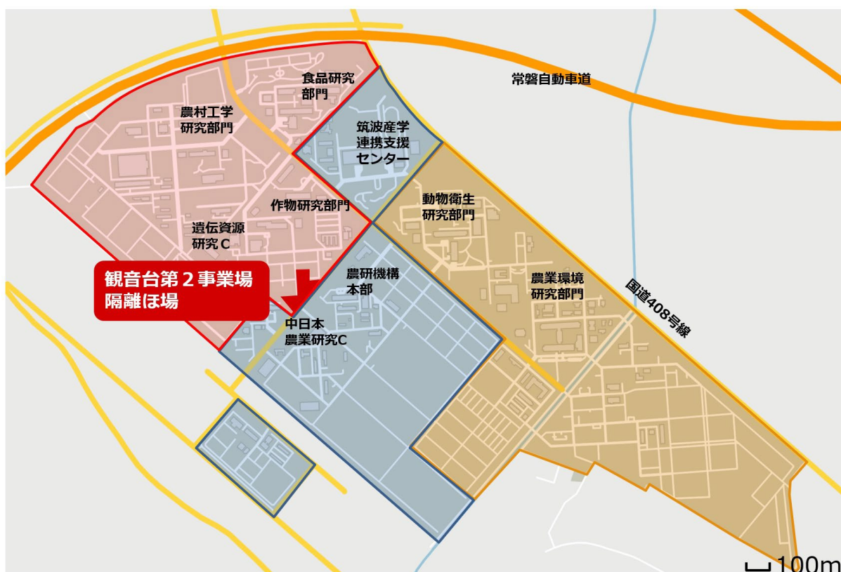
図 1 農研機構観音台地区周辺の地図と観音台第2事業場隔離ほ場の配置