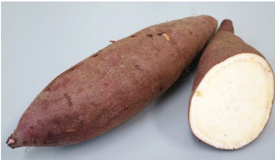
「べにひなた」の塊根