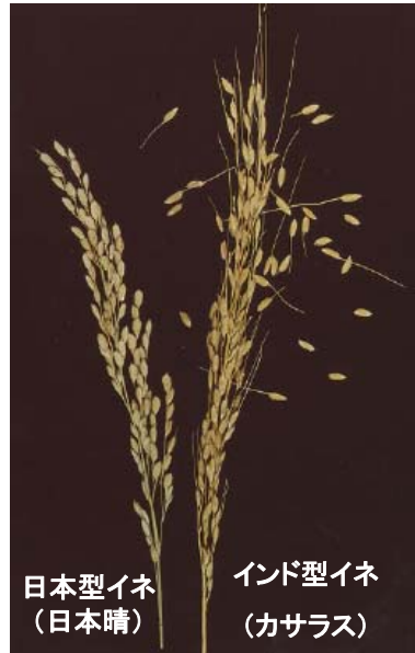
図1. 実験に用いたイネ

日本型イネの品種日本晴は穂が実っても脱粒しないが、 インド型イネの品種カサラスは穂が実ると軽くさわっただけで、脱粒する。