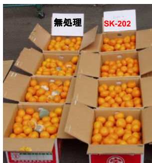
温州みかんにおけるSK-202の腐敗抑制効果