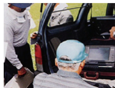
ノートパソコンをほ場に持ち込み、生育調査結果を入力して生育診断を行う生産者