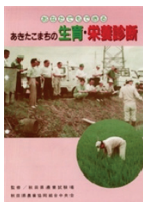
水稲生育診断システム 利用マニュアル

システムの開発に当たっては、秋田県内の土壌タイプ別に土壌窒素発現モデルの策定を行い、地域ごとに設定した目標収量を得るための生育時期別理想窒素吸収量を決定した。また、稲体の窒素吸収量については、生育時期別に草丈、茎数、葉緑素計値から求める窒素吸収量推定モデルを作成し、これらを統合して生育ステージ毎に追肥窒素量を客観的に決定できる水稲生育栄養診断技術を開発した。こうした技術開発は、水稲生育診断システム利用マニュアル、水稲生育診断システム（パソコン用ソフト）として生産現場で活用されている。