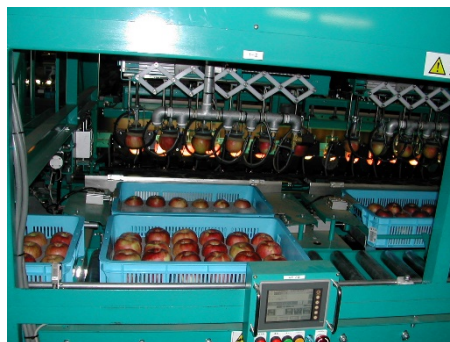
もも、なし、りんご、トマトなどに用いた選果ロボット