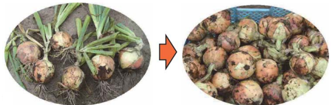
調製前 → 調製後 開発機によって調製されたタマネギ