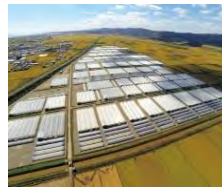
亘理町浜吉田団地