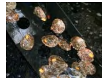
アワビの増殖技術