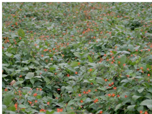
写真: 上から、「生育中のマルバルコウ」、「実生」、「花」、「果実」、「ダイズ畑を覆っている状況」。

大豆の群落が完成して光が遮断されると生育が抑制されるので、大豆群落完成までにつるにならないように、中耕や除草剤を組み合わせる回数防除を行う。