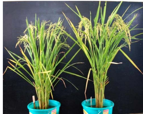
IRRI146 + SPIKE

SPIKE 遺伝子の導入で穂や株が大きくなり、籾数が増加 (いずれの写真も左が元の品種で、右が SPIKE 遺伝子を導入した系統)