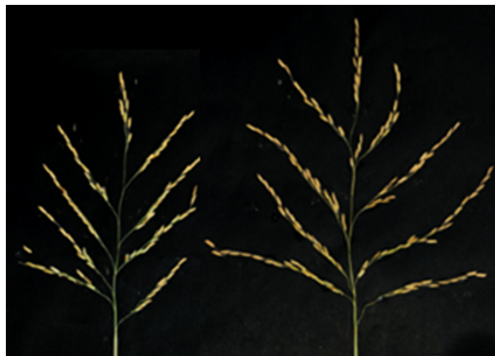
IR64 + SPIKE