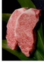
さしに加え新たな旨み成分の評価指標を開発 旨み成分に富む和牛の改良技術を開発