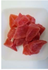
赤果肉りんごのセミドライフルーツ