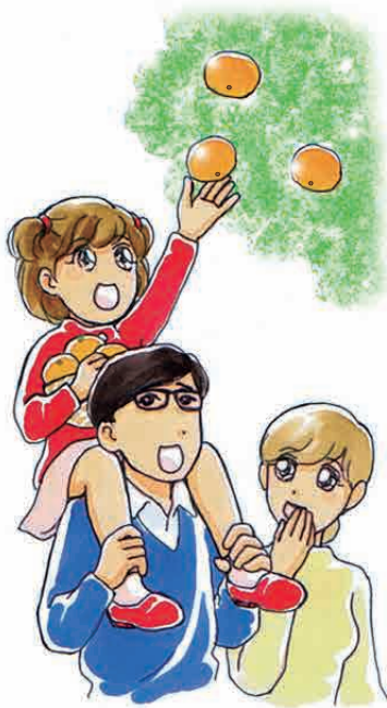
みどり と パパ と ママ

これから本格的なミカンの季節になります。ミカンは国内で最も多く作られている果物で、美味しいミカンを作るためにいろいろと工夫されています。今回は、美味しいミカンを安定して作ることができる新技術を紹介します。この技術は「マルドリ方式」と呼ばれており、ミカン畑の地面をシートで覆う「マルチ栽培」