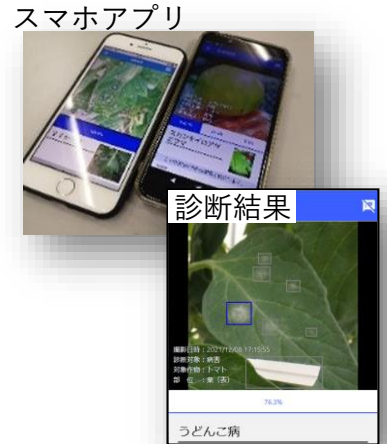
病害虫名を診断 (現地試験にて正答率約80%)