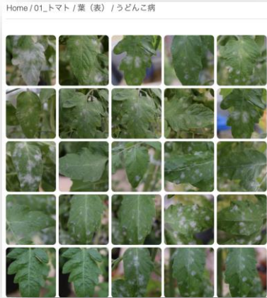
4作目約50万枚の画像データ